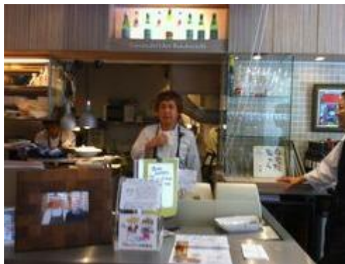
カーサ・マリーノ