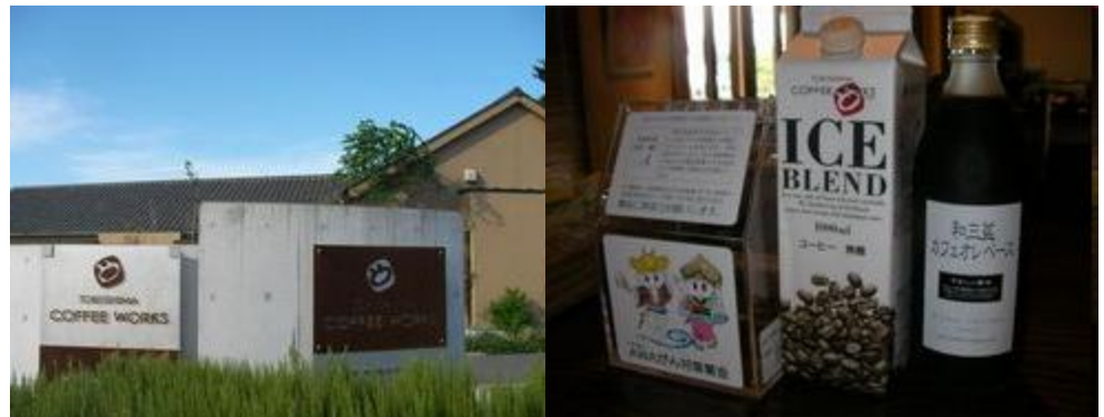
TOKUSHIMA COFFEE WORKS